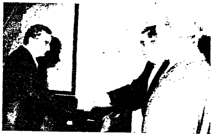
تم سفر إيطاليا الجديدة في لبنان السيد استيفانو اورتوا اوراق اعتباره الرئيس سركيس قبل ظهر أمس بحضور وزير الخارجية السيد فؤاد بطرس ، وذلك في ظل مراسم تذكارية

الصلح: السلام آت ومستمر ونتمنى ضبط النفس وانتهاء التجاوزات